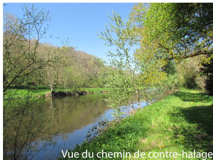
Vue du chemin de contre-halage